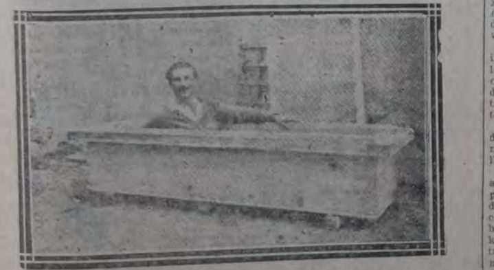
El cofre en que el experimentador quedó herméticamente encerrado por espacio de una hora y cuarto

clavos, pueden realizarse sin entera molestia previa, y con más razón sin la pretendida insensibilidad obtenida por hipnosis, auto-sugestión, o cualquier otro medio físico-psíquico. Pero queda una laguna en esa demostración. ¿No habían estado ciertos fakires cerca de haber estado ciertos fakires cerca de una hora realmente encerrados y enterrados en atitudes de dimensiones corrientes? ¿Cómo explicar ese hecho, y durante cuánto tiempo puede un hombre normal soportar sin perjuicio esa sensación hermética en una caja de un contenido de unos 400 litros de aire? Los datos del problema son bastante complejos. Teóricamente, el ritmo de 15 inspiraciones de medio litro de aire por minuto, se obtendría la cifra de 50 minutos. Pero en la práctica, el aire rechazado por los pulmones contiene todavía oxígeno, y se forma una nueva mezcla. Por otra parte, a medida que el aire se vicia, el ritmo respiratorio se acelera. Los análisis consultados al respecto hablan de una duración muy variable, que oscila de 15 a 40 minutos. Del a su método de experimentación directa, Paul Henzé hizo hacer una caja herméticamente cerrada de hojalata de zinc soldada, y cuya tapa tenía